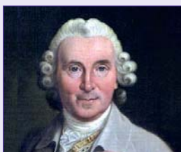
James Lind (1716 - 1794)

... A James Lind le llevó cuatro décadas que se aceptara su descubrimiento de que el zumo de limón puede curar el escorbuto