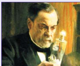
Louis Pasteur (1822 - 1895)

... Si hubiera vivido en esa época, ¿no le habría ayudado?